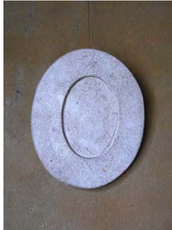
« Qui es-tu ? » ( 26 x 21 x 1,5cm )

En étant face à l'argile Je sens sa douceur Sa force souple Sa fragilité quand elle sèche Et le temps immanent à l'argile J'ai l'impression de toucher le temps calme Dans l'argile Et cet acte peut s'accorder À quelque chose dans mon corps Et il réveille mon esprit En poursuivant cet esprit Je crée la forme