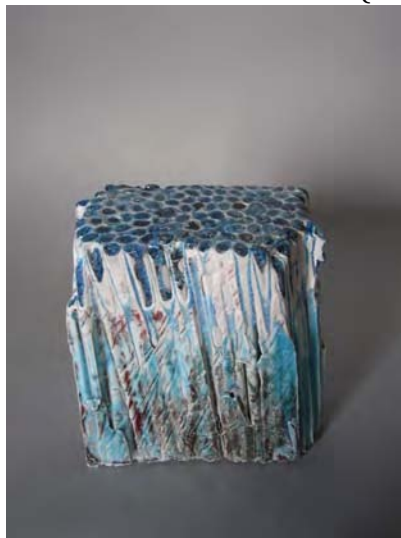
« La grâce » ( 15 x 10 x 17cm )

Sous l'influence de son père qui était aussi céramiste, il a commencé à pratiquer la céramique. Il est attiré par la céramique pour sa matière naturelle et par l'intérêt de la cuire. Ses œuvres consistent à réunir plusieurs tubes de céramique et par ces tubes il représente les empreintes de passage d'un homme ou d'un objet et ces empreintes se multiplient au fer à mesure. Il y cherche la beauté de la fragilité.