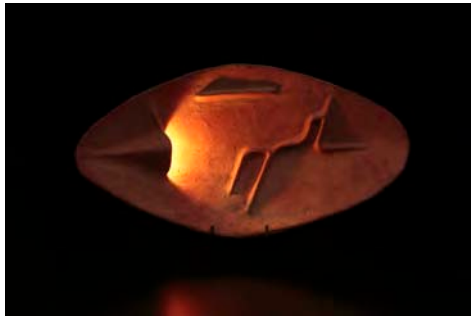
« Lampe en forme de bouclier, cuisson en fosse » ( 55,6 x 6,6 x 29,1 cm )

Matière et technique : Terre cuite primitive, Cuisson en fosse