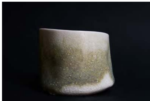
« Ondulante Lichen Bol »

( 12,5 cm de diamètre x 9cm de hauteur )