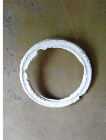
« Sans titre » ( 28 cm de diamètre x 1,5 cm d'épaisseur )