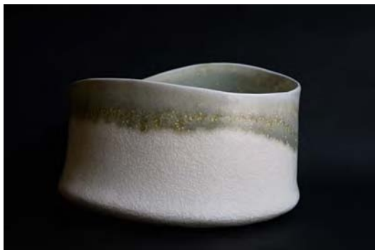
« Ondulante Lichen Bol »

Matière et technique : Modelage, Porcelaine