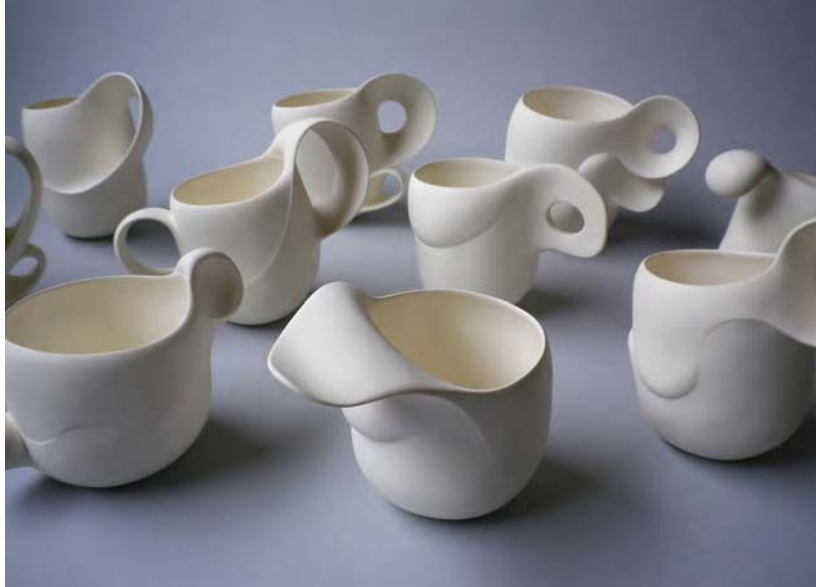
« Danse »

Matière et technique : Installations, porcelaine modelée