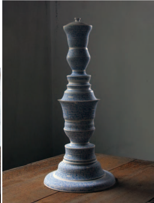
« Vase » ( 50 cm de hauteur )