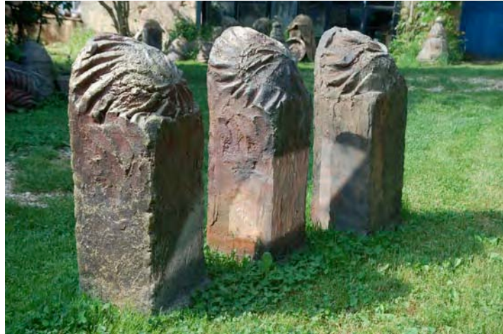
« Cippes » ( 90 cm de hauteur )

Matière et technique : Grès, Cuisson au bois