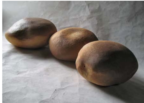
« Galets » en combinaison ( 60 x 130 x 60cm )