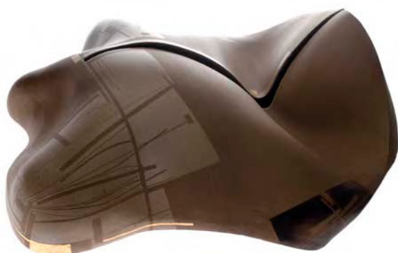
« Sans titre » ( 55 x 43 x 22 cm )