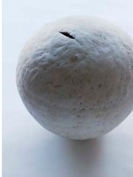
« Swollen Vesse » ( 38 × 40cm )

Technique et matière : Grès tourné, dynamisme de la forme