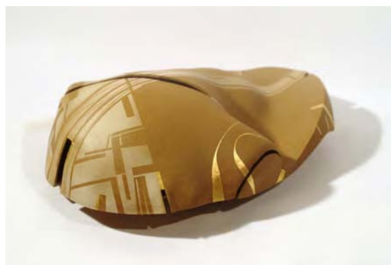
« Sans titre » ( 58 x 43 x 16 cm )