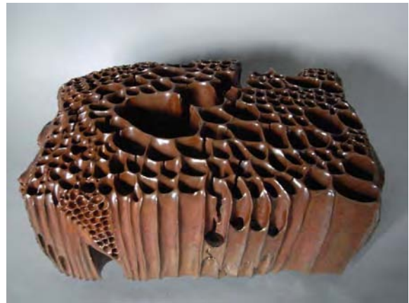
« Pur » ( 52 x 33 x 20cm )