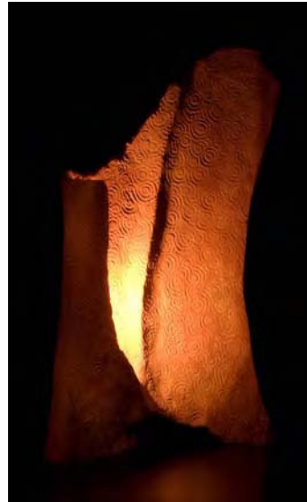
« Lampe, cuisson en fosse » ( 29 x 10,1 x 49cm )

Il utilise le four appelé « Four dragon » dont la morphologie allongée s'apparente à celle d'un dragon, particulièrement efficace pour obtenir les plus hautes températures. Ce genre de four a presque disparu au Japon. Il pratique le type « Namban » dont l'origine se trouve au Sud de la Chine, et ce style le fait reconnaître dans le domaine de la céramique au Japon. Le type Namban a, pour lui, la tradition antique et il en apprécie surtout les caractères vivant, clair et simple. Il cherche toujours à se rapprocher de la céramique primitive.