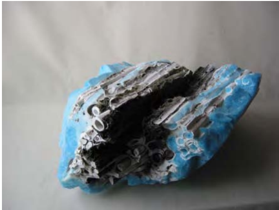
« La vérité dans le sentiment » ( 51 x 45 x 33cm )

Matière et technique : sculpture porcelaine (recherches d'émaillage)