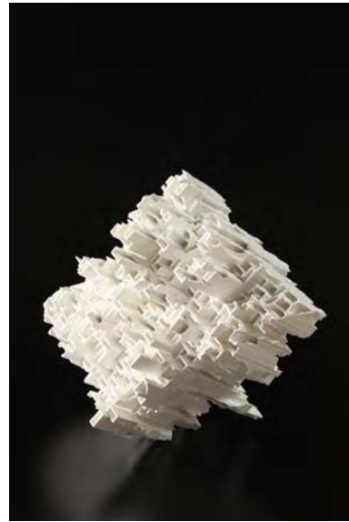
« Modern Remains 2010 » ( 43x37x45cm )

Quand il était à l'Université, il commence à s'intéresser à l'art plastique et il entre au Centre de la Céramique et du Design de Tajimi pour acquérir la connaissance technique et industrielle de la céramique. Au début il participe à la production du design de l'éclairage. C'est à la suite d'un accident dans son four que l'artiste a trouvé son nouveau concept sur ses œuvres : « La complexité et l'ordre », « la solidité et la fragilité ». Ces éléments se mêlent sur son œuvre et arrivent à créer une forme futuriste qui évoque la nostalgie des ruines des cités mayas. Après avoir moulé la porcelaine de Seto dans des tubes de section carrée, il les casse avec un marteau au hasard, sans idée préconçue et il insiste pour « détruire pour créer ». C'est la nouvelle tendance de la céramique du XXI ème siècle.