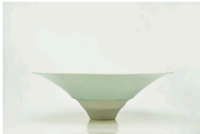
« Objet en porcelaine à décors au bleu et vert de cobalt » ( 46 cm de diamètre x 16,5 cm de hauteur )

Après son séjour à Londres, elle commence à réfléchir non à la perfection technique mais au message qu'elle peut transmettre par l'intermédiaire de la céramique. C'est toujours de la vaisselle, des objets que l'on peut utiliser dans la vie quotidienne. Pour elle, un bol sert à quelque chose mais, en même temps, il doit transmettre des informations aux humains.