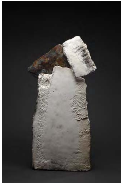
« Mégalithe » ( 80 cm d'hauteur )

Elle aime peindre, assembler, graver et associer à la terre différents matériaux (pierre, plexi, métal, verre...)