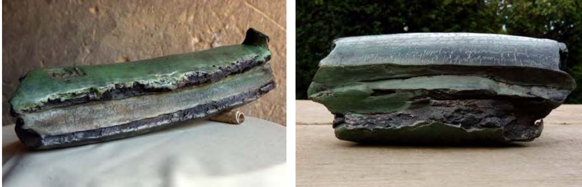
« Installation' graines' » ( entre 15 et 20 cm de largeur x 15 cm de hauteur )

Elle mène un travail de recherche sur l'écriture. Le mot, le signe, le trait, sont pour elle les moyens de transcrire des charges émotives et sensorielles.