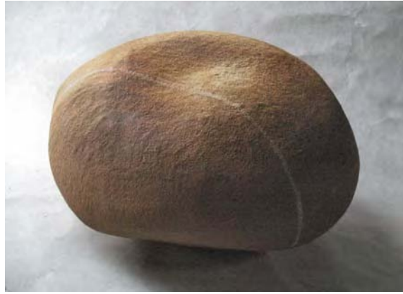
« Galet-2 » ( 45x50x 30 cm )

Matière et technique : Grès chamotte, Modelage