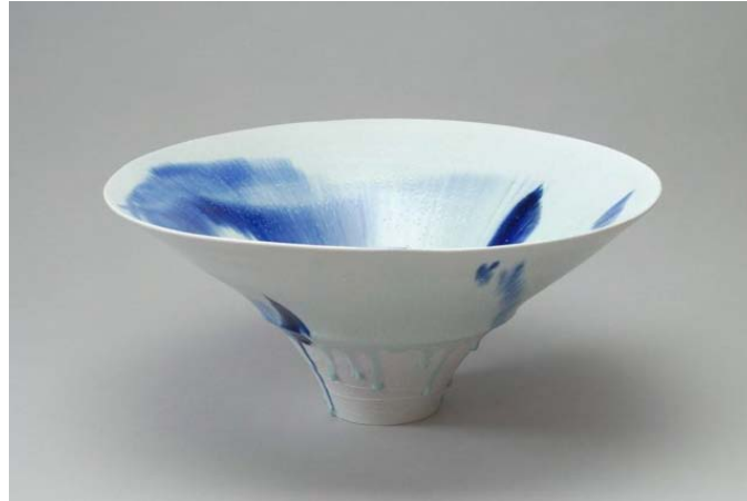
« A · i - 2009 - » ( 46 cm de diamètre x 21 cm de hauteur )

Matière et technique : Porcelaine tournée, finesse et dynamisme