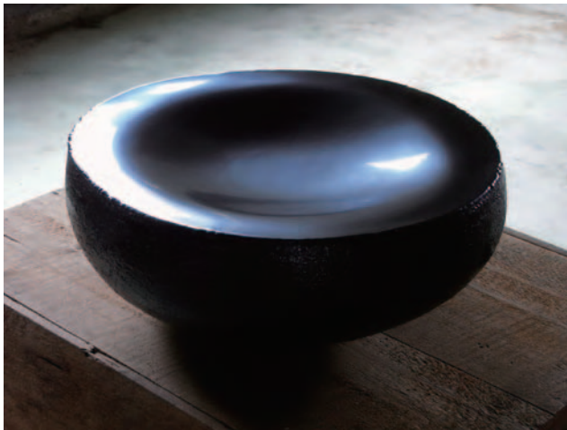
« La forme de sommeil » ( 43x43x18h cm )

Matière et technique : Porcelaine avec application de laque