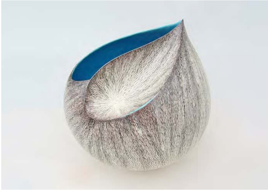
« Shell '10 – éclore 1-» ( 52 x 53 x 56 cm )

Matière et technique : Grès, sculpture abstraite, recherche sur l'émail