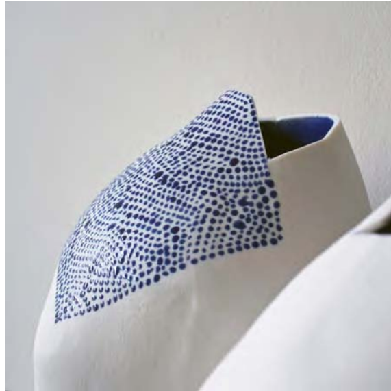
« Ensemble de 3 vases » (de 27 cm à 50 cm de hauteur x de 20 cm à 33 cm de diamètre)

La grande liberté que lui a offerte la porcelaine l'a amené jusqu'à ces vases qui sont construits de façon impulsive et informelle. Il s'est inspiré de patchworks pour élaborer la technique de montage. Les décors sont réalisés à l'émail appliqué par petites gouttes, au pinceau. Ils sont posés sur les pièces de façon abstraite pour souligner les formes ... La porcelaine, laissée nue, fait apparaître discrètement la trame d'un tissu qui évoque les draps en lin.