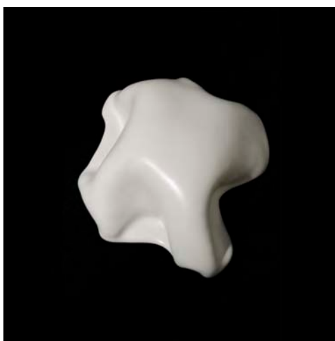
« Blanches Nobes »