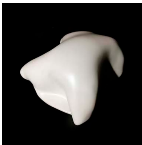
« Blanche Nobe Grande »